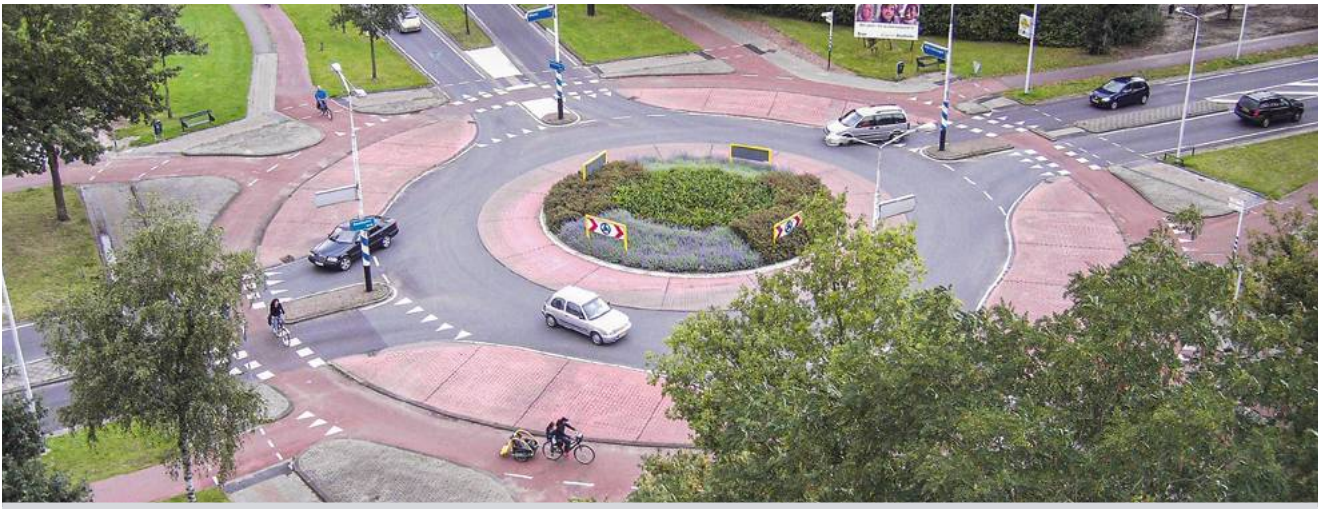
geschützter einspuriger Kreisverkehr